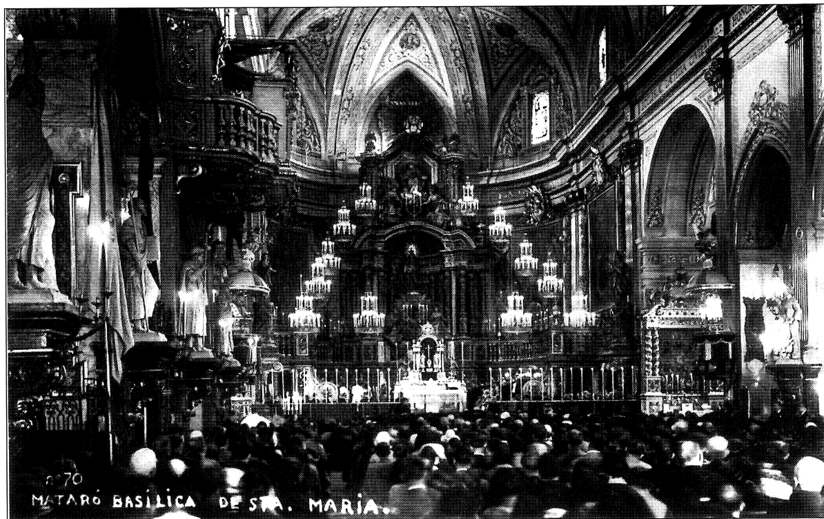
Basilica de Santa Maria de Mataró