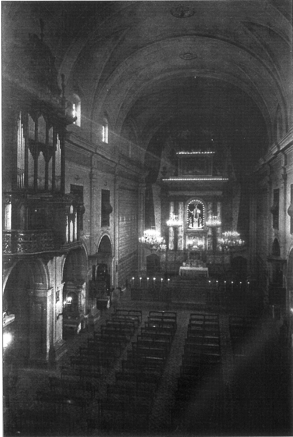
Sant Baudili de Sant Boi de Llobregat