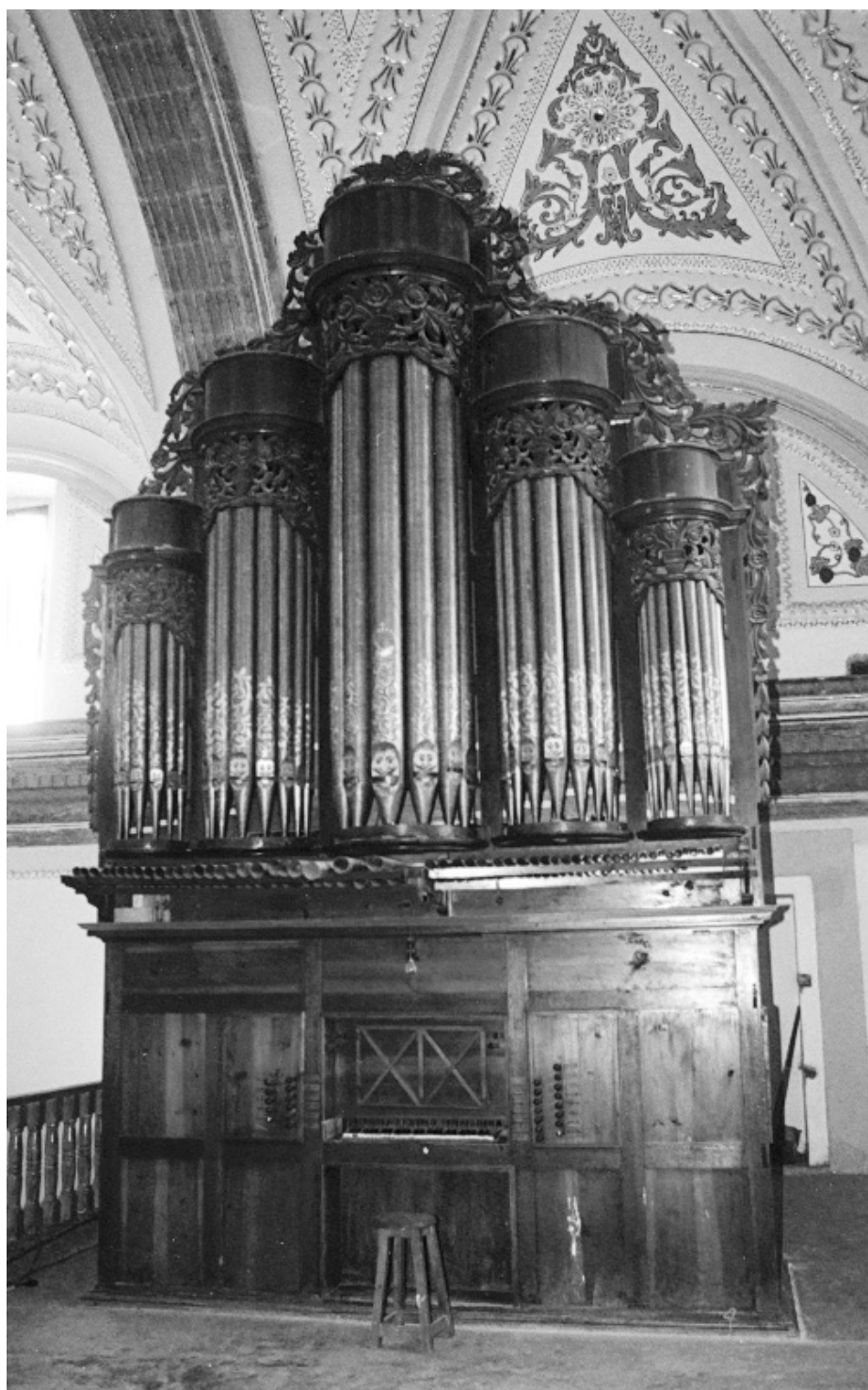
Fig. 5. Vista general de la fachada del órgano histórico de Santa Inés Zacatelco. [Fotografía: Edward Pepe (2014)].