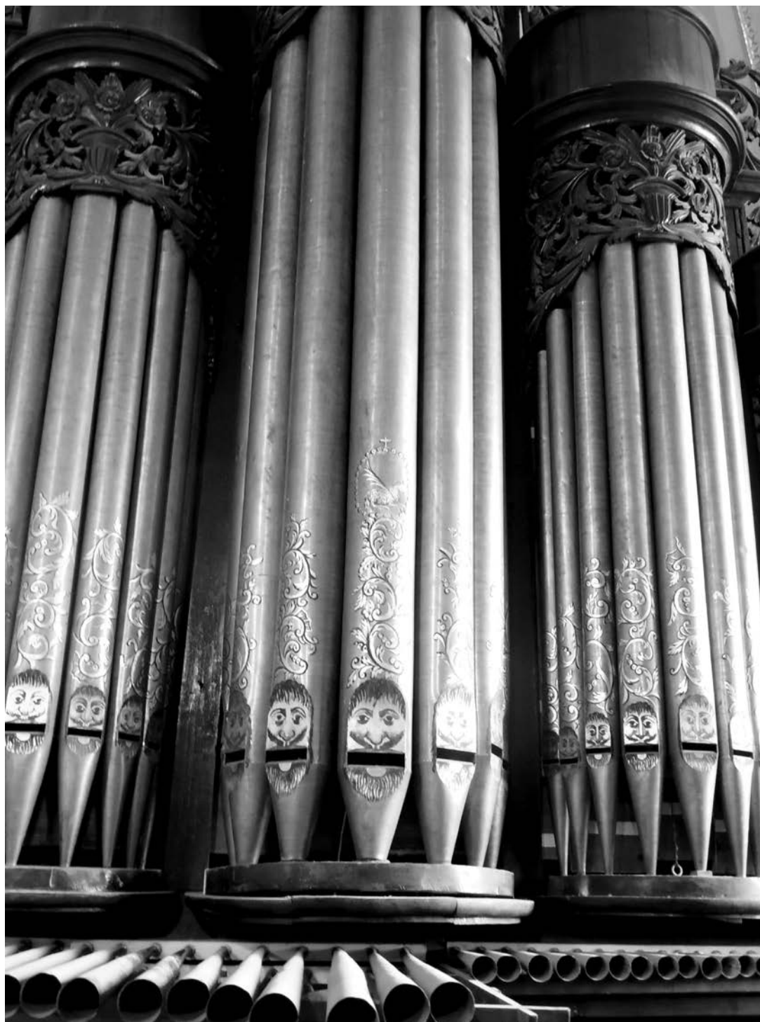
Fig. 4. Detalle de los tubos de la fachada del órgano histórico de Santa Inés Zacatelco.