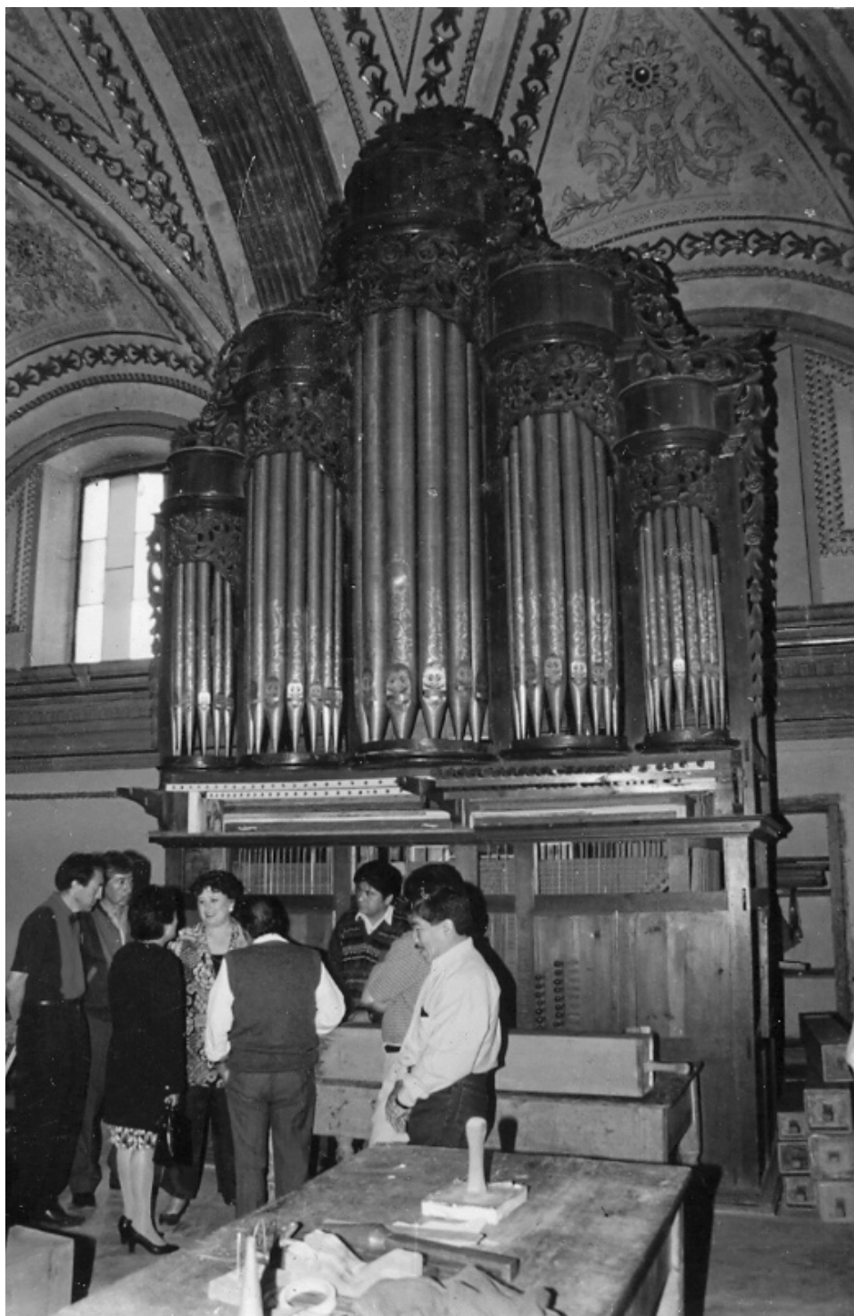
Fig. 1. Órgano histórico de Zacatelco durante la restauración de 1998 (visita de autoridades del DIF del Estado de Tlaxcala).