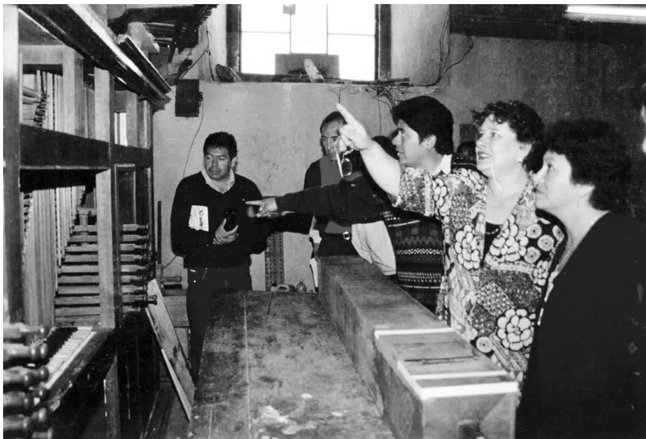
Fig. 2. Órgano histórico de Zacatelco durante la restauración de 1998.